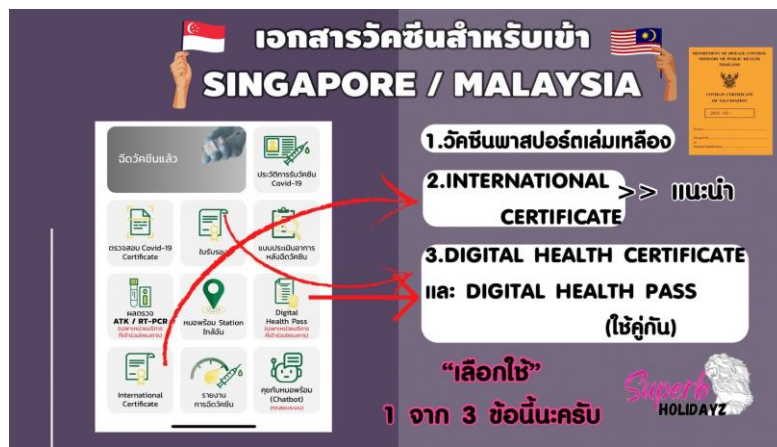
International Covid19 Vaccination Certificate

ไม่รวมค่าทิปไกด์+ค่าทิปคนขับรถเหมาจ่ายท่านละ 1,500 บาทชำระที่สนามบินสุวรรณภูมิ (ไม่รวมค่าทิปหัวหน้าทัวร์ตามความพึงพอใจ)